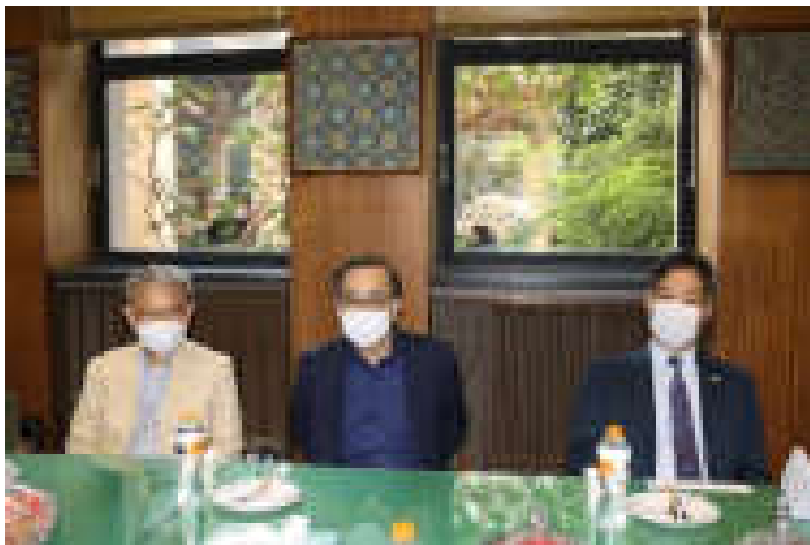
از راست به چپ: جناب آقای ایکاوا سفیر ژاپن در ایران، آقای پروفسور ناتیهاتا رییس دانشگاه هنر تاما و آقای پروفسور ری ایچی میاکه، مدیر موزه آرکی دیات و استاد مدعو دانشگاه علوم توکیو