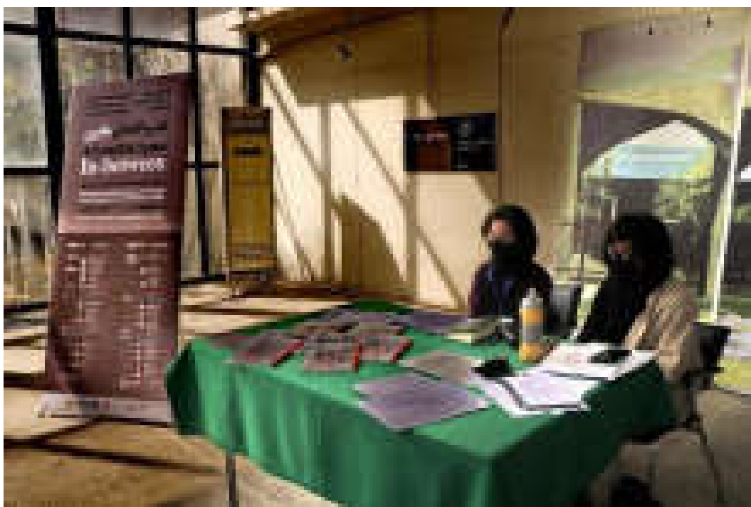
میز ثبت نام سمپوزیوم بین المللی هنر و فضای مابین واقع در درب داخلی نگارخانه ی تهران و درب بیرونی نگارخانه تهران